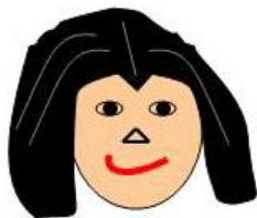
Hairline with widow's peak